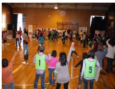
余暇活動イベント 「じゃん・けん・PON!」