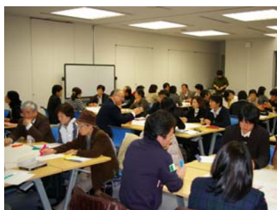
公開講座 「ボランティア養成講座」